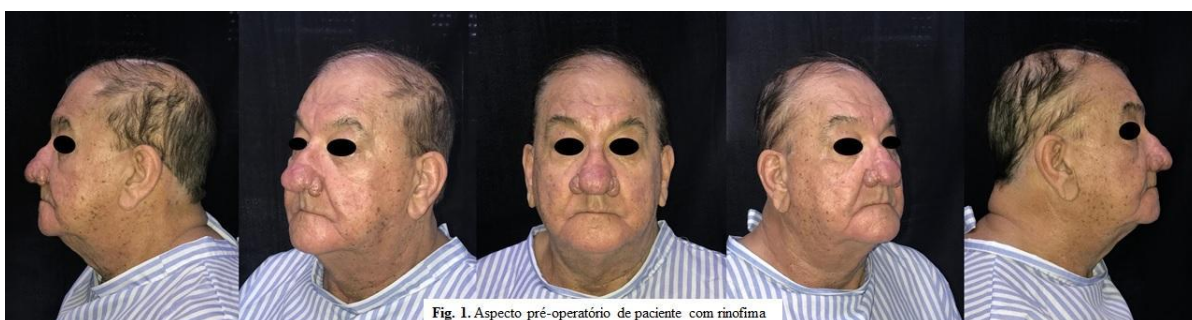
Fig. 1. Aspecto pré-operatório de paciente com rinofima