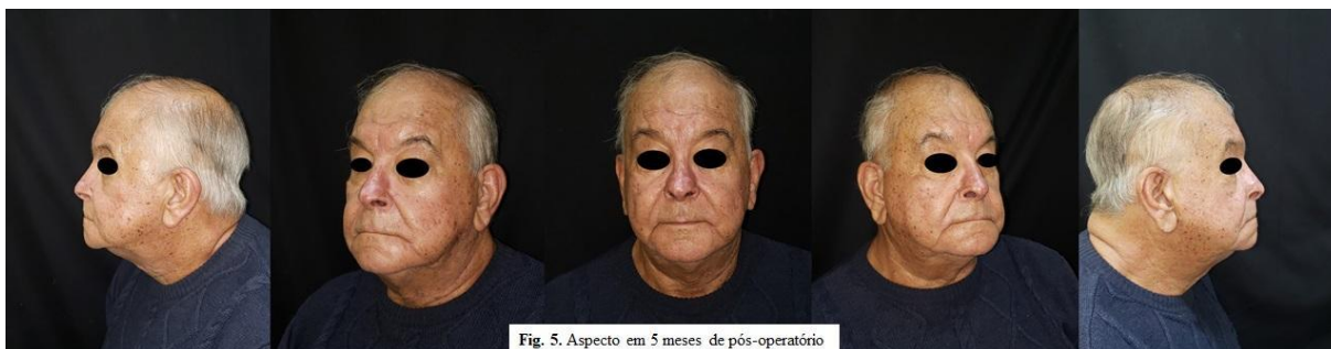
Fig. 5. Aspecto em 5 meses de pós-operatório